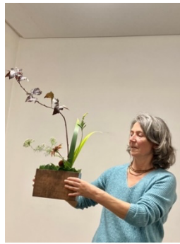
Physocarpus, Irisblätter, Echinacea